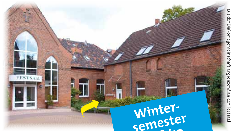
Haus der Diakoniegemeinschaft angrenzend an den Festsaal